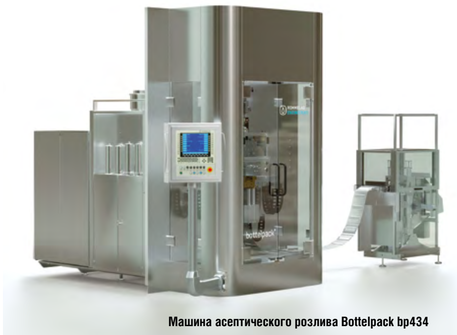
Машина асептического розлива Bottelpack bp434

времени мы сопровождаем заказчиков, предлагая индивидуальное послепродажное обслуживание, как, например, сервисные пакеты для монтажа, ремонта и техобслуживания, включая поддержку при повторных квалификациях и валидациях. Такие решения, как предупредительное обслуживание, сокращают до минимума время незапланированного простоя и повышают производительность предприятия. Наш недавно образованный отдел модификаций предлагает модернизацию даже для машин, построенных более 30 лет назад. Этот сервис не только обеспечивает замену деталей, которые более не производятся, но и предлагает адаптировать машины к новым требованиям рынка или регуляторным нормам», – добавил г-н Обенауэр.