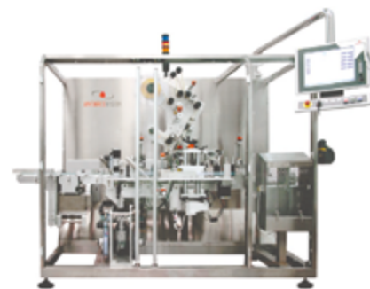
Станция сериализации ALL IN ONE

Antares Vision постоянно растет и расширяет географию своего присутствия и в настоящее время имеет 8 офисов (в Италии, Германии, Франции, США, Бразилии и Южной Корее) и широкую сеть квалифицированных партнеров, в более чем 50 странах по всему миру для обеспечения пред-