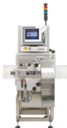
Станция сериализации Print&Check EVO