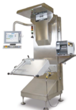
Полуавтоматическая станция агрегации TOP VIEW

Сердцем компании Antares Vision является научно – исследовательская команда. Компания активно использует бизнес-модель, которая полностью зависит от развития технологий совместно с университетами, исследовательскими центрами и другими организациями. Результатом данного инновационного подхода стало повсеместное узнавание, в том числе две награды European Business Awards, а также престижный грант Horizon 2020 на разработку и усовершенствование оборудования для проверки лиофилизатов.