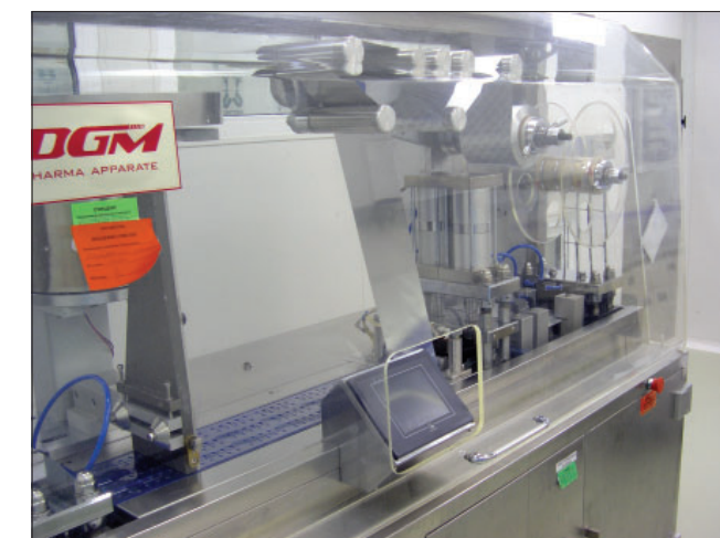
Блистерный автомат DGM BM-140, Швейцария