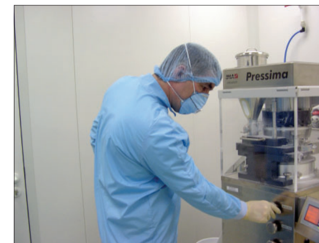
Работа оператора на таблетировочном прессе

Основной итог 20-летней работы, как мы его видим – это завоевание доверия потребителей и врачей к нашей продукции. Следовательно, все дальнейшие усилия предприятия будут направлены на поддержание этого доверия.