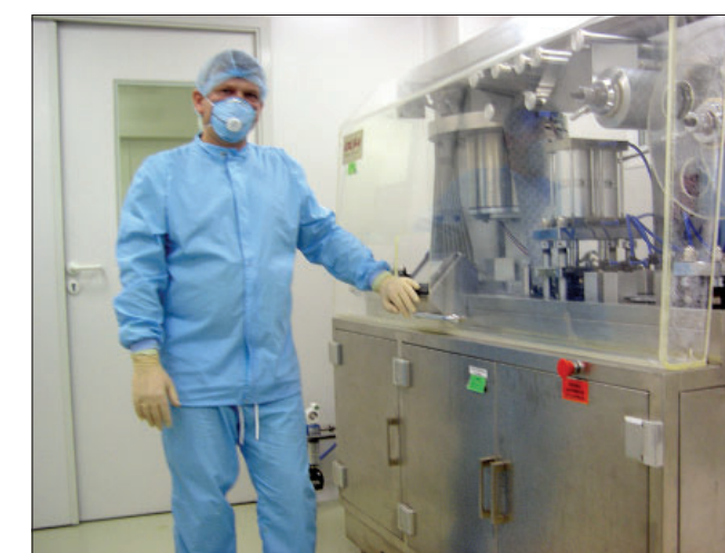
Работа на блистерном автомате