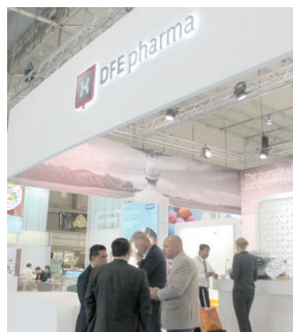
На стенде «DFE Pharma»

ЗАО «ФПК ФармВИЛАР», постоянный посетитель фармацевтического форума, традиционно проводил встречи и переговоры с российскими фармпроизводителями на стендах своих партнеров – компаний «Evonik», «DFE Pharma», «Dr. Paul Lohmann» и «ShinEtsu».