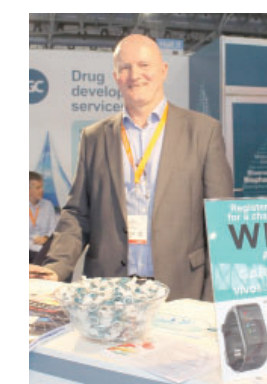
N. Malone, «LGC»

На выставке испанская компания « Sharlab », дистрибьютором которой в России является широко известная компания Химмед, представила химические продукты, расходные материалы.