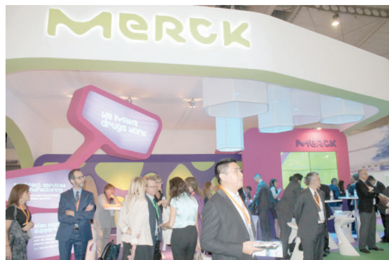
На стенде «Merck»

ЗАО «ФПК ФармВИЛАР», постоянный посетитель фармацевтического форума, традиционно проводил встречи и переговоры с российскими фармпроизводителями на стендах своих партнеров – компаний «Evonik», «DFE Pharma», «Dr. Paul Lohmann» и «ShinEtsu».