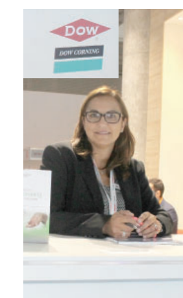
D. Manca, «Dow Corning»