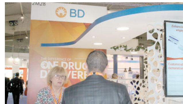
М. Giaccone, «BD»

На стенде компании «Datwyler» – встреча с представителями «Эректон», которая в прошлом году отметила 20-летний юбилей сотрудничества с «Datwyler», являющейся мировым лидером по производству резиновых пробок и алюминиевых колпачков для фармупаковки.