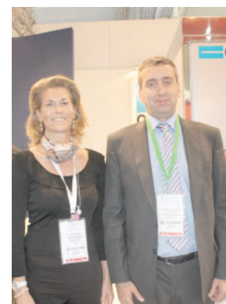
В. Cavalli, Ch. Trapaglia, «Coster»