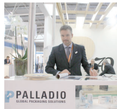
На стенде итальянской фирмы «Palladio»