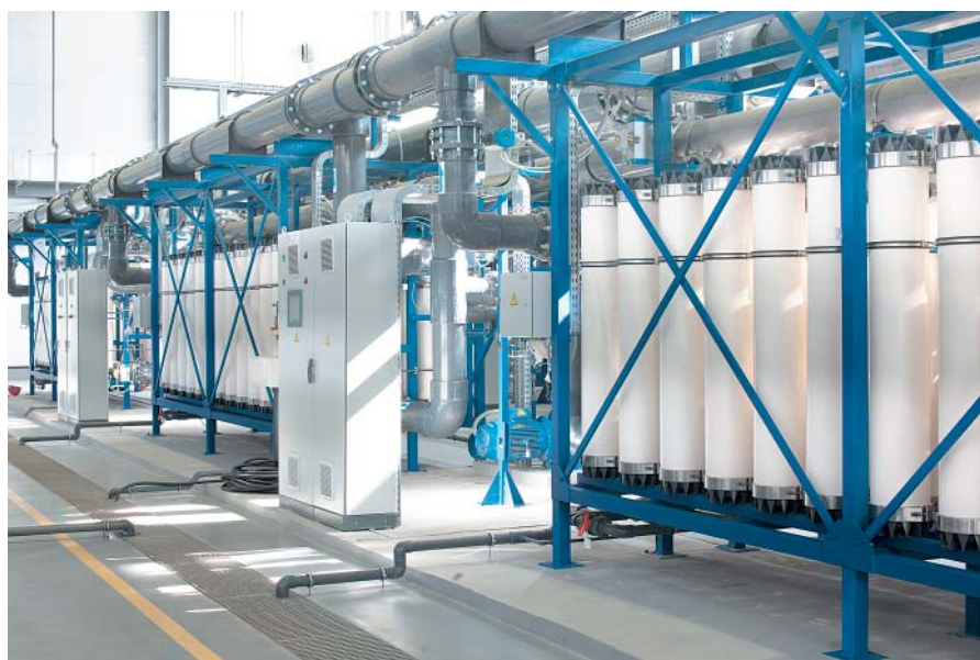
Фото 3. Мембранные технологии

Основной принцип данной технологии основан на выделении всех токсичных загрязнителей в виде концентрата и получения высокоочищенной воды, которую возможно использовать повторно, например, для приготовления пара (Фото 3).