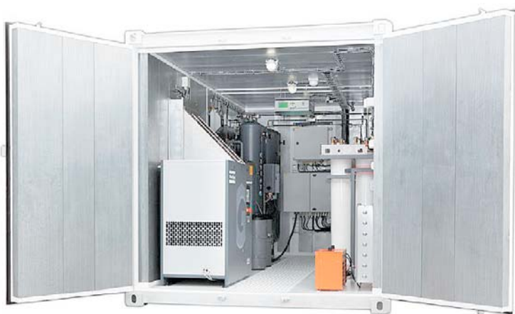
Контейнерное решение технологии высокоинтенсивного окисления

ной деструкции органических примесей в воде), так и как предварительная, при которой начинает эффективно работать биологическая очистка (с целью снижения энергозатрат). Методы интенсивного окисления позволяют обезвредить токсичные для микроорганизмов соединения, препятствующие их развитию и блокирующие биологическую переработку органических веществ. Комплексная технология позволяет очистить стоки до требований к сбросу в водоемы рыбохозяйственного назначения (Фото 2).