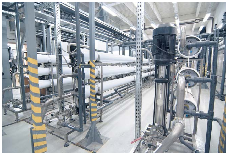
Система обратного осмоса