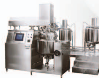
■ Оборудование для производства лекарств полутвердой формы