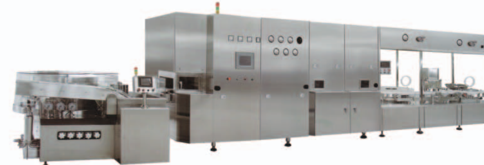
■ Ампульная и Флаконная линия