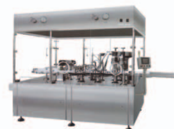
■ Оборудование для производства лекарств жидкой формы