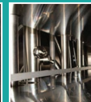
Side nozzles, wide range spraying