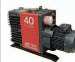
BOC Vacuum Pumps