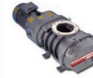
BOC Roots Pumps

Для создания вакуума используется вакуумный насос BOC Edwards.