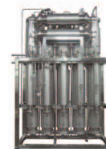
■ Оборудование для водоподготовки и емкостное оборудование