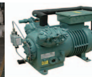
Bitzer two-stage cooling compressor