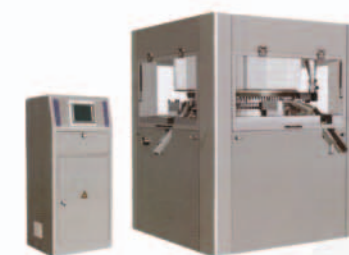
■ Оборудование для производства лекарств твердой формы