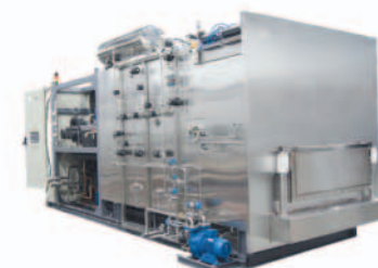
■ Лиофильная сушка