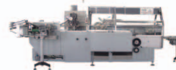
■ Упаковочное оборудование