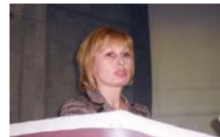
Т. Лома, «Медиана-фильтр»