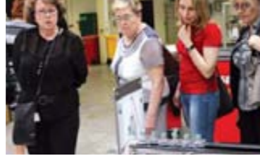
Осмотр упаковочной линии розлива