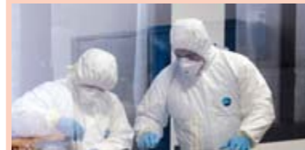
Чистые зоны на производстве «ИМА»