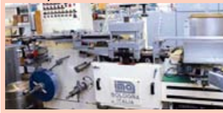
Самая первая блистерная машина IMA-60-ых годов