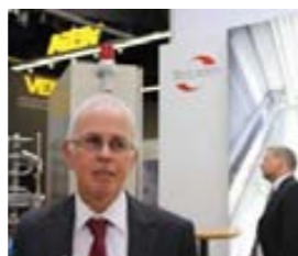
В. Зэх, «Ruland»