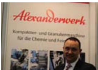
Д. Нейбх, «Alexanderwerk»