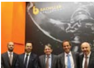
Команда компании «BACHILLER» Барселона, Испания