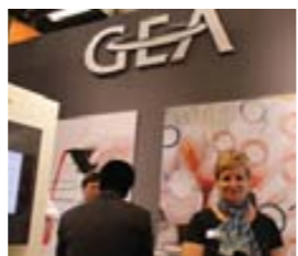
Ш. Лайонс, «GEA»