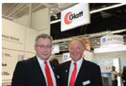
Л. Хайнцль и Р. Бёбер, «Glatt»

TechnoPharm, интернациональный форум для проектировщиков и операторов