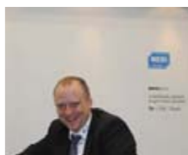
М. Кухн, «KST»