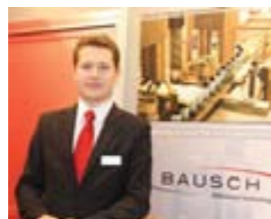
А. Гойденко, «BAUSCH»