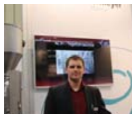
С. Гей, «Gustav Obermeyer»