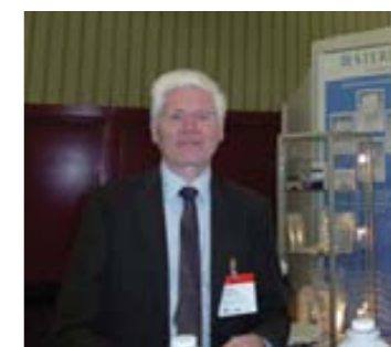
Г. Лауф, «Steris»

На выставке было распространено более 200 экземпляров нашего журнала.