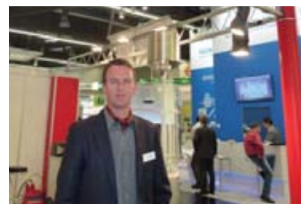
И. Краусе, «KG-PHARMA»