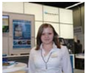
А. Вальтер, «VIDEOJET»