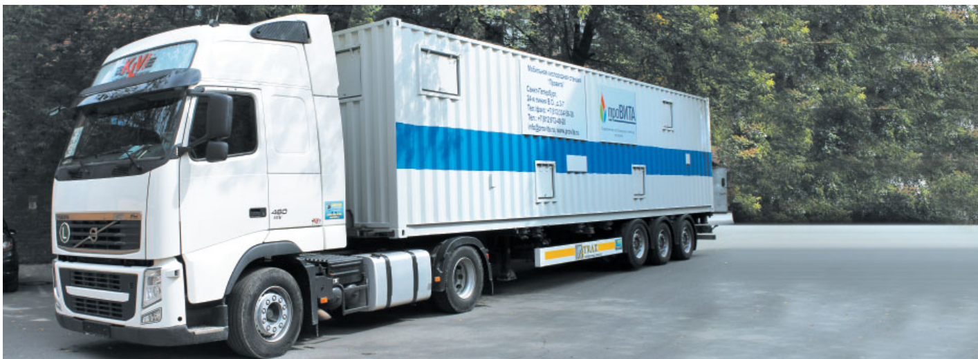
Фото 3. Мобильная кислородная станция