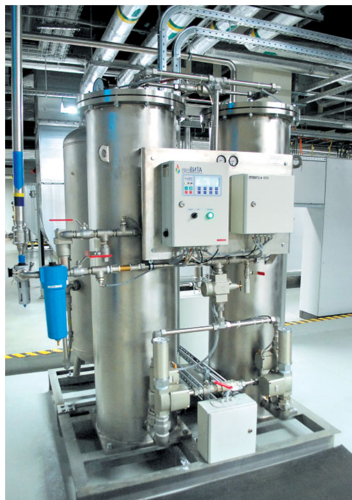
Фото 2. Адсорбционная азотная установка на одном из фарм-предприятий Санкт-Петербурга

В качестве дополнительных опций используются бустеры для повышения давления производственного газа, в том числе для заправки газа в баллоны.