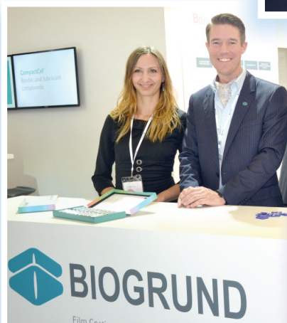
М. Перова, R. Dartsch, Biogrund