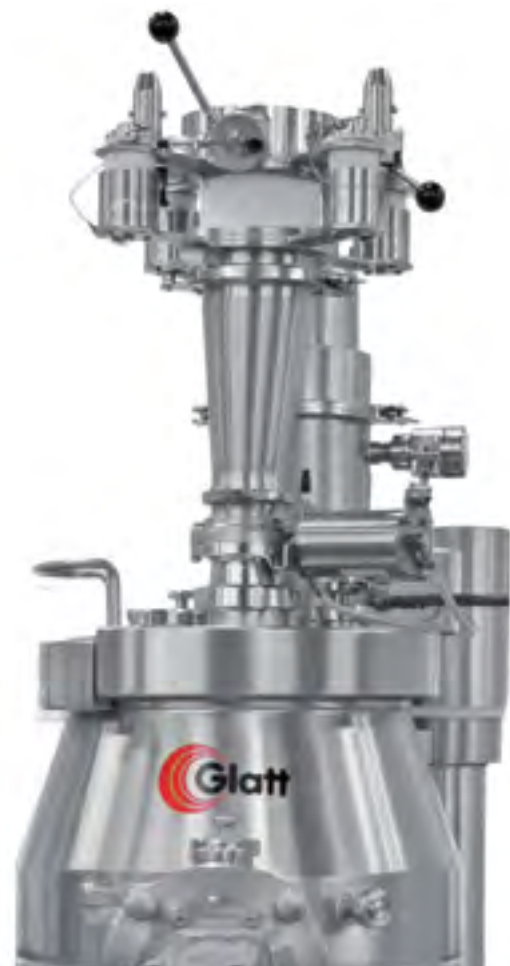
Вертикальный гранулятор типа VG100 в комплекте с системой загрузки с клапаном TKS