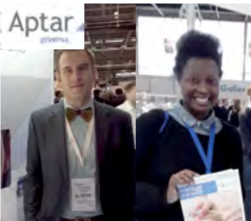
J. Probst, E. Eschylle, «Aptar Pharma»