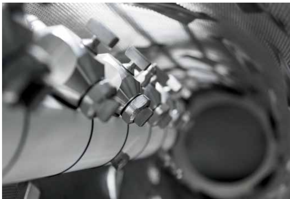
CROMA , новая машина для непрерывного нанесения оболочки