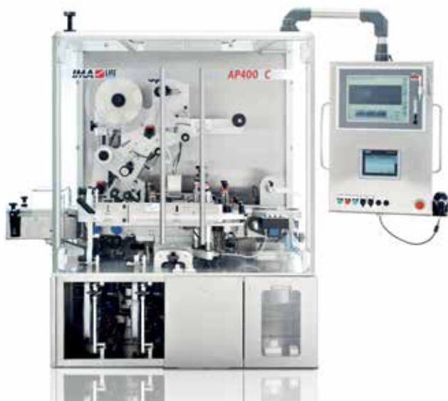
Этикетировочная машина SENSITIVE AP400 CW

SENSITIVE AP400 COMPACT – это последняя разработка IMA Life в области нанесения этикетки. Сокращение длины машины до 1400мм повышает доступность проведения эффективной интеграции с большим количеством разнообразных упаковочных линий, где основными предпосылками являются наличие небольшого пространства при необходимости обеспечения высокой производственной скорости. Представляемая новая этикетировочная машина SENSITIVE AP400 CW является разработкой, нацеленной на будущее фарминдустрии. Эта машина позволяет наносить этикетки на 3 стороны картонной пачки, оснащена позитивной системой транспортировки. Осуществляется наукоёмкий процесс непрерывного взвешивания - 100% контроль качества.