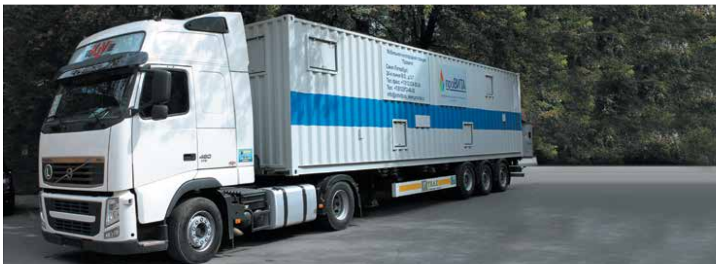
Фото 3. Мобильная кислородная станция