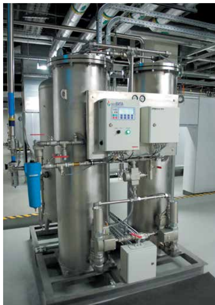
Фото 2. Адсорбционная азотная установка на одном из фарм-предприятий Санкт-Петербурга

В качестве дополнительных опций используются бустеры для повышения давления производного газа, в том числе для заправки газа в баллоны.