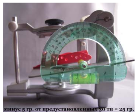
минус 5 гр. от предустановленных 30 ти = 25 гр.