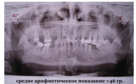
средне арифметическое показание = 46 гр.

установленным в артикуляторе – для этого устанавливали показание угла суставного наклона, вычитая или прибавляя к предустановленному в артикуляторе (обычно 30 гр.). При наклоне передней части шаблонной плоскости вниз – угол уменьшается, вверх – увеличивается. Удерживая угломер, вставленный в держатель на боковой части шаблонной плоскости в нулевом положении, наклоняли вниз или вверх шаблонную плоскость, прикрепленную к столику, до достижения нужного угла суставного наклона. К примеру, если был определен угол суставного наклона 46 гр., то к 30-ти предустановленным нужно было добавить 16, поэтому переднюю часть шаблонной плоскости (с верхней моделью в ложке), поднимали на 16 гр., следуя шкале неподвижно удерживаемого в нулевом положении угломера. Следом за гипсовывали верхнюю модель в ложке с шаблонной плоскостью – в верхнюю раму артикулятора. Удаляли ложку с ш.плоскостью и за гипсовывали модель н/ч в нижнюю раму универсального артикулятора, сопоставив в прикусе с верхней моделью. Таким образом, без серьезных затрат времени достигается более точное, чем "на глазок", расположение моделей челюстей в межрамочном пространстве универсального артикулятора и исключается ряд допусков при произвольной гипсовке, неточностей. Хотелось бы применять самые точные артикуляторы и лицевые дуги во всех работах, но пока большинство работ производят в универсальных артикуляторах, подспорье, описанное в этой статье, не будет лишним. Удачи Вам и всех благ!