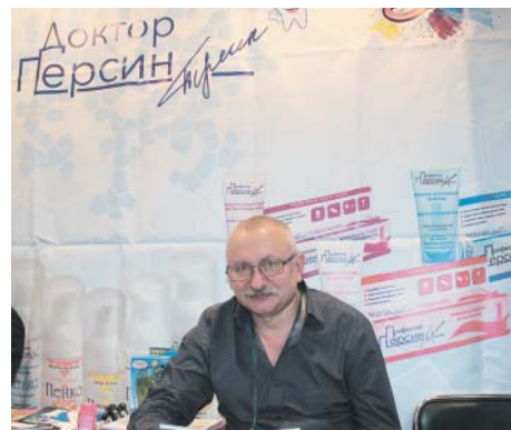
Л. Саликов, «Доктор Персин»