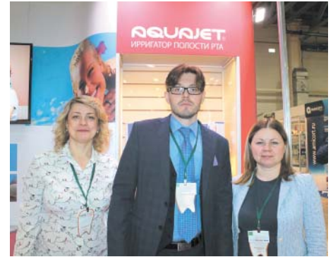
На стенде компании «Aquajet»

В общей сложности за три дня работы конференции Стоматологической Ассоциации России «Актуальные проблемы стоматологии» ее образовательные мероприятия посетили свыше 1200 человек.