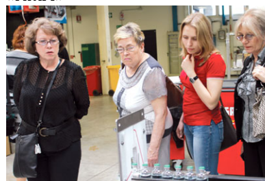
Осмотр упаковочной линии розлива