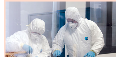
Чистые зоны на производстве «ИМА»