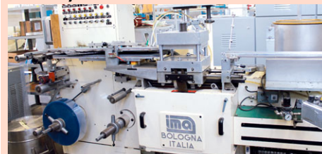
Самая первая блистерная машина ИМА-60-ых годов