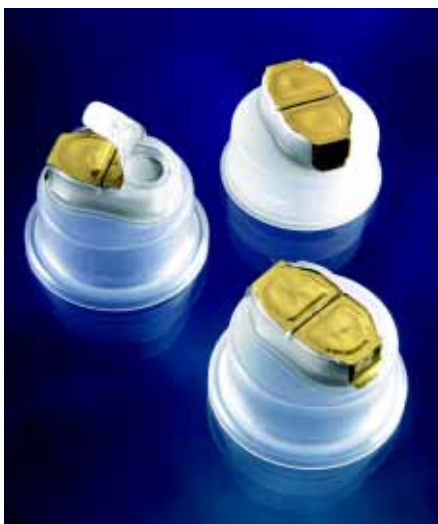
Инфузионные крышки InsoCap

Крышки InsoCap предназначены для укупорки инфузионных растворов во флаконах Bottelpack. Это уникальное техническое решение для операций «выдув-наполнение-герметизация (запайка)». Для защиты от загрязнений и порчи зона инъекции запечатана фольгой.