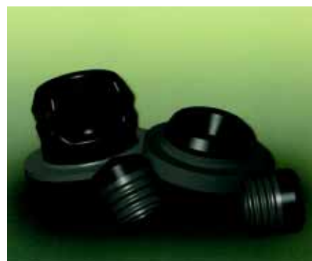
Пробки и плунжеры с покрытием Flurotec

Особого внимания заслуживает уникальная разработка компании - покрытие FluroTec. Оно не имеет аналогов в мире и предназначается специально для чувствительных и агрессивных препаратов (онкологических). Покрытие FluroTec создает эффективный