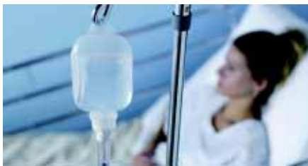
Спайка крышки InsoCap и флакона Bottelpack обеспечивает герметичность