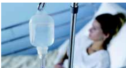
Спайка крышки InsoCap и флакона Bottelpack обеспечивает герметичность