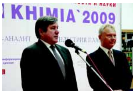
Слева И.С. Матеров, зам. министра промышленности и торговли РФ и М.П. Толкачев, зам. генерального директора ЦВК «Экспоцентр»

Главный отраслевой форум химического комплекса России – 15-я международная выставка химической промышленности и науки «Химия-2009» состоялась с 28 сентября по 2 октября 2009 года в павильонах №№ 2, 8 и на открытых площадках Центрального выставочного комплекса «Экспоцентр». Выставка организована ЗАО «Экспоцентр» при содействии ЗАО «Росхимнефть», при поддержке и участии Министерства промышленности и торговли РФ, Российского Союза химиков, Европейского Совета химической промышленности (CEFIC), под патронатом Торгово-промышленной палаты РФ и Правительства Москвы. 29 стран-участниц: Австрия, Бельгия, Великобритания, Германия, Дания, Индия, Италия, Казахстан, Канада, КНР, Латвия, Нидерланды, Польша, Республика Беларусь, Республика Корея, Россия, Румыния, США, Тайвань, Турция, Украина, Узбекистан, Финляндия, Франция, Чехия, Швейцария, Швеция, Эстония, Япония. Значительная часть экспонентов «Химии-2009» работает на фармацевтическую промышленность, что иллюстрируют сделанные нашим фотокорреспондентом снимки.