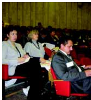
В зале конференции