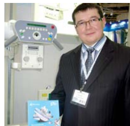
Р.А. Ветров, «Паритет-рентген»