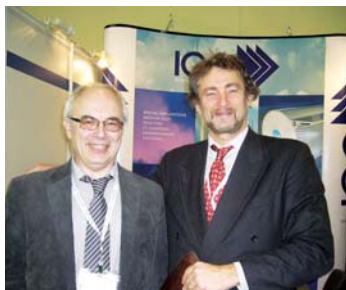
С.Г. Родионов, Г-П.Кертс, «Медицинские рентгеновские трубки»