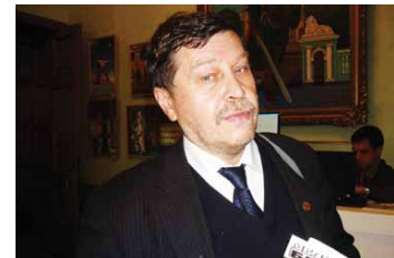
А.А.Веселов, «Петербургская городская дезстанция»

Экспонент выставки конгресса НПФ «ВИНАР» – первая российская компания, которая разработала и изготавливает продукцию для комплексного контроля дезинфекции и стерилизации. Группу компаний, продвигающих оборудование по обработке эндоскопов, представляли «КлинДез» и «Джонсон&Джонсон». Медицинские технологии по уходу за пациентами, лечению ран и профилактике ИСМП продвигала компания «Пауль Хартманн». Сфера интересов компании «Kiilto»- гигиена рук, обработка инструментария, очистка и дезинфекция поверхностей, профессиональная уборка. Фирма «Lamsystems» проектирует «чистые помещения» для операционных.