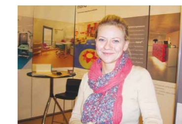
Т.Королева, «nora systems GmbH»