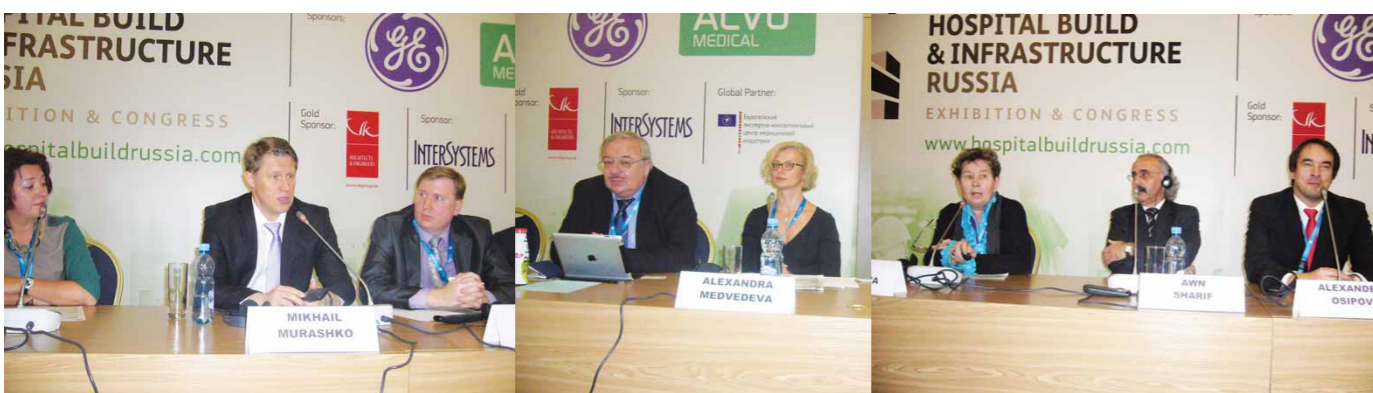
В президиуме конгресса