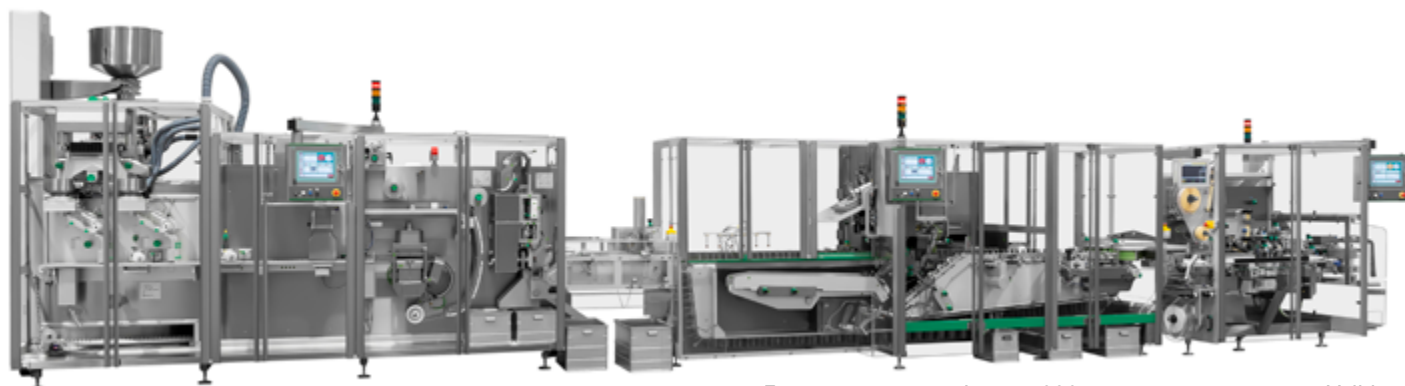
Блистерная линия Integra 320 с подающим модулем Valida

Пьяноро (Болонья). Полным ходом идут приготовления к главному событию года – выставке Achema, которая состоится во Франкфурте этим летом. Ожидается, что стенд Marchesini площадью 800 м 2 (Зал 3.1, стенд G3) будет одним из самых посещаемых на этой ключевой немецкой площадке. На своем стенде компания представит шесть отдельно стоящих машин и пять линий, среди них последние разработки для Track&Trace, сериализации и асептической упаковки . По традиции, высоким технологиям идут рука об руку с итальянским гостеприимством : гости смогут попробовать гастрономические изыски региона Эмилия-Романья в ресторане и баре на стенде Marchesini. Для гостей также будет оборудована зона виртуальной реальности , позволяющая оценить главные технологические достижения компании.