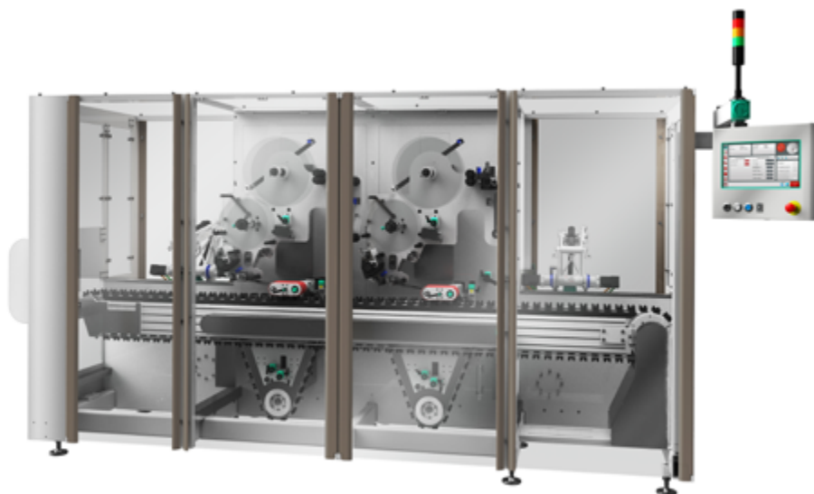
Этикетировочная машина BL-H235

Achema 2018 станет площадкой, на которой Marchesini продемонстрирует сразу несколько новейших разработок для сериализации . Например, этикетировочная машина BLH 235 способна наносить эти-