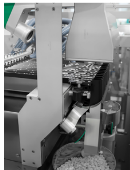
Блистерная линия Integra 320 с подающим модулем Valida

Marchesini также продемонстрирует линию наполнения туб.