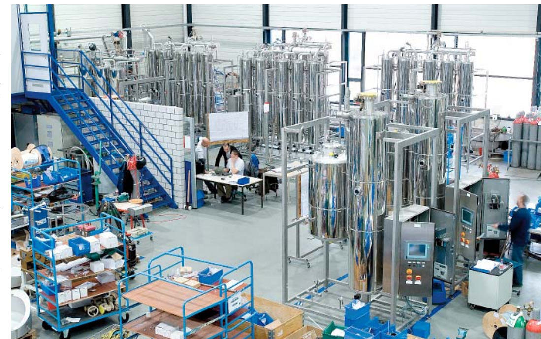
Производство BWT в Эш (Швейцария) всегда загружено работой