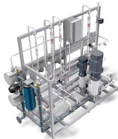
Установка двухступенчатого обратного осмоса BWT

Различия в нормативных требованиях, колебания состава исходной воды, влияние традиций и опыта, производительность, режим использования, доступность энергоносителей, требования по контролю и регистрации, бюджетные ограничения, – и это далеко не полный список факторов, определяющих разнообразие применяемых установок производства воды очищенной и воды для инъекций. Компания BWT, лидер рынка фармацевтической водоподготовки, следуя политике дифференциации, регулярно расширяет линейку оборудования. В этом помогают наши 4 научно-исследовательских центра в Западной Европе, где разрабатываются и совершенствуются самые передовые технологии.