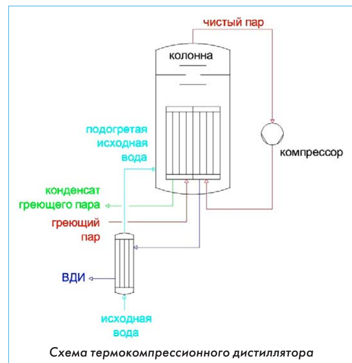
Схема термокомпрессионного дистиллятора

Основным преимуществом термокомпрессионных дистилляторов является их экономичность, по этому параметру они существенно превосходят все вышеописанные модели.