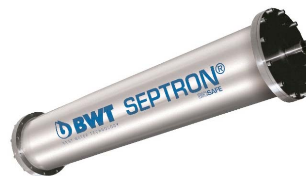
Модуль электродеионизации BWT Septron

Установки OSMOTRON производятся уже не один десяток лет и известны во всех уголках земного шара. В них реализована технология получения воды очищенной методом непрерывной электродеионизации с предварительной стадией обратного осмоса. Не раз OSMOTRON удостоивался высоких оценок специалистов.