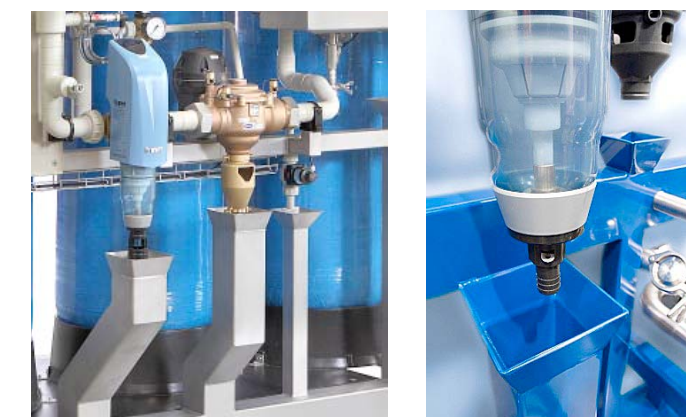
Дренажная рама установки

Для достижения большей компактности функция дренажа передана раме установки. Рама покрыта специальным эпоксидным составом и оканчивается отводящим фланцем.