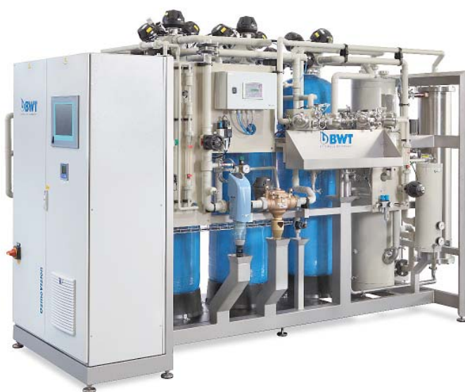
Установка BWT OSMOVISION

В исходной воде, как правило, содержится хлор и углекислый газ. Хлор опасен для обратноосмотических мембран, а углекислый газ повышает электропроводность пермеата и блокирует модули электродеионизации. Для удаления хлора традиционно используется угольный фильтр, загрузка которого подлежит регулярной замене и утилизации. Для удаления углекислого газа все чаще применяются энергоёмкие модули мембранной дегазации.