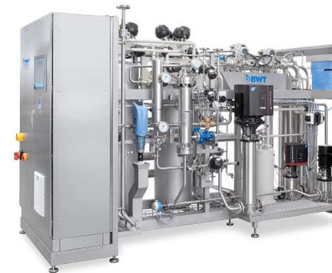
Все элементы установки OSMOTRON легко доступны для обслуживания

потребление воды исходной до 75%, а потребление электроэнергии до 40%. Также увеличивается срок службы установки, благодаря уменьшению количества производственных циклов.