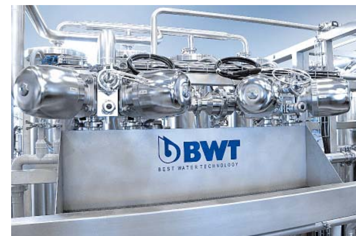
Блок MULTIJOINT с удобным приемником для отбора проб

Для минимизации доступных зон и оптимизации дизайна установки применяется компактный блок MULTIJOINT, который заменяет большое количество арматуры.