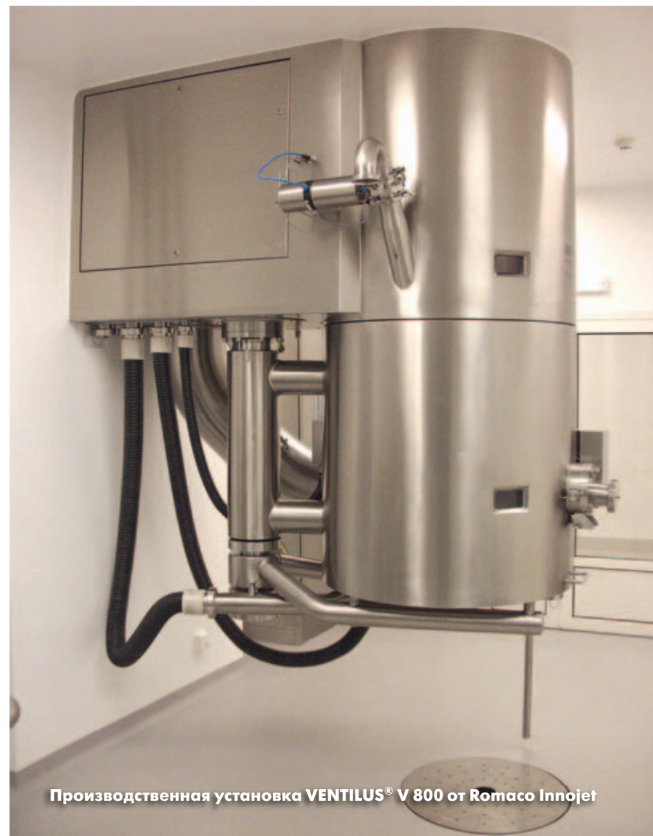
Производственная установка VENTILUS® V 800 от Romaco Innojet

При производстве мультипартикулярных таблеток швейцарское фармацевтическое предприятие Acino с 2004 года делает ставку на технологии Romaco Innojet. В настоящий момент на заводе в Лисберге применяются пять технологических установок серии VENTILUS®, предназначенных для покрытия оболочкой микропеллет. Спрос на эту инновационную пероральную лекарственную форму растет во всем мире.