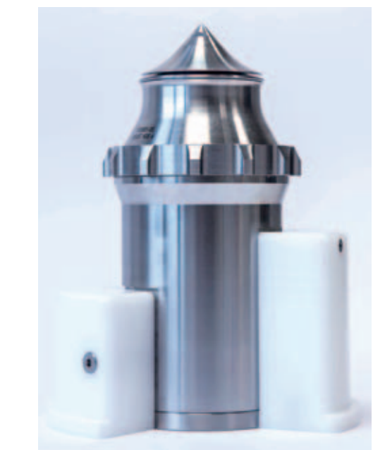
Рис. 3. Расположенная в центре днища резервуара форсунка с кольцеобразным распылительным отверстием