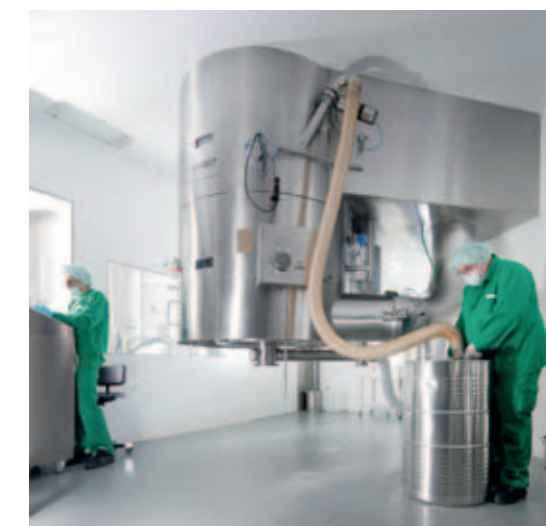
Рис. 1. Производственная установка VENTILUS® V 800 от Romaco Innojet в процессе эксплуатации на заводе компании Acino Pharma в Лисберге, Швейцария

При изготовлении пеллет компания Acino с 2004 года применяет метод «движимого воздухом» слоя, который был разработан почетным доктором Гербертом Хюттлином и получил международный патент. На заводе Acino в Лисберге используются пять производственных установок серии VENTILUS® от Romaco Innojet; кроме того, опытная установка того же типа применяется в отделе исследований и разработок. Установки производственного масштаба оснащены резервуарами емкостью 800 литров и предназначены для партий размером до 600 кг. Несмотря на преимущества данной технологии является экономия места. «Метод „движимого воздухом“ слоя объединяет все необходимые процессы для создания пеллет активного вещества и гранулята на одной установке, – поясняет Михаэль Тевельде, эксперт рабочей группы по грануляции компании Acino Pharma. – Если бы мы использовали другую технологию, потребовалась бы гораздо большая площадь для установки оборудования плюс дополнительные складские помещения».