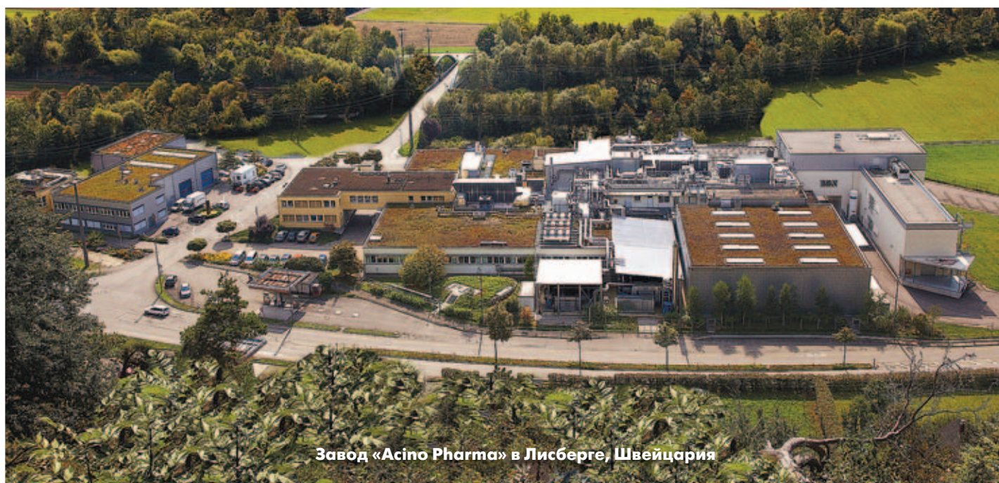
Завод «Asino Pharma» в Лисберге, Швейцария