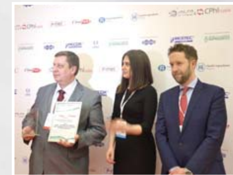
Слева И.А. Наркевич, ректор «Спб Химико-фармацевтическая академия»