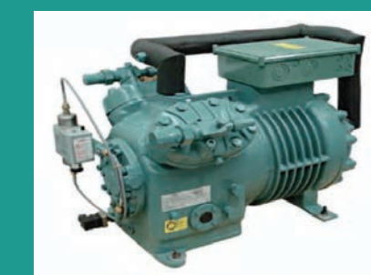
Две стадии охлаждения компрессора

Компрессоры для системы охлаждения произведены мировыми лидерами в этой отрасли, такими как: BITZER (Германия), MYCOM (Япония).