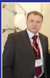
С.Г.Макеев, «Bosch», «Pharmatec & SBM»