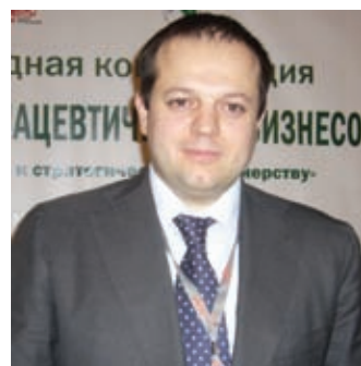
Р.А. Заливацкий, министр экономического развития Калужской области