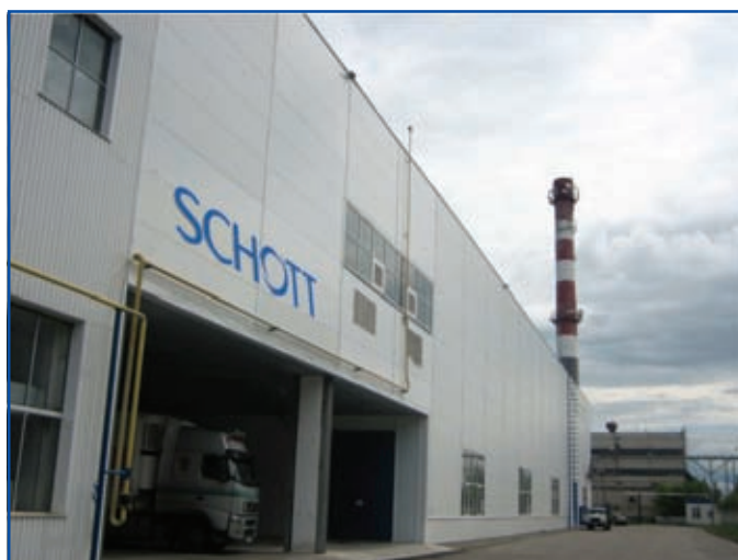
Завод компании ООО «ШОТТ Фармасьютикал Пэкэджинг» в г. Заволжье