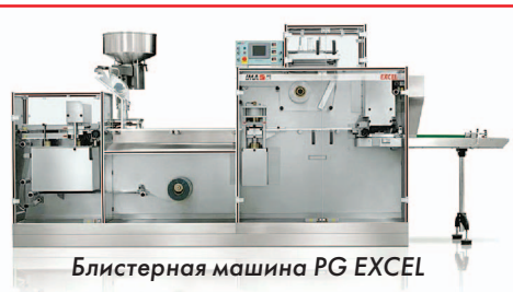
Блистерная машина PG EXCEL

Такая деятельность стала наиболее важным фактором роста успеха IMA-PG на высококонкурентном рынке производителей оборудования.