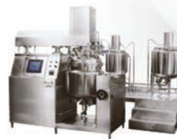
Оборудование для производства лекарств полутвердой формы