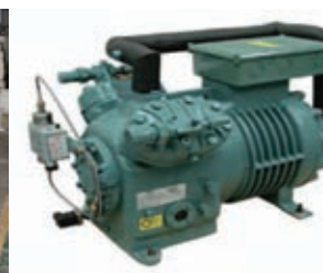
Bitzer two-stage cooling compressor