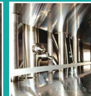
Side nozzles, wide range spraying