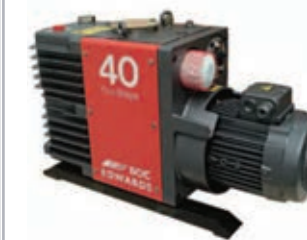
BOC Vacuum Pumps