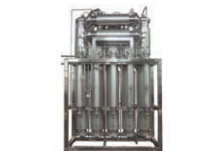
Оборудование для водоподготовки и емкостное оборудование