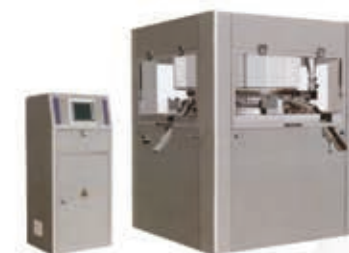
Оборудование для производства лекарств твердой формы