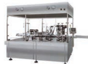
Оборудование для производства лекарств жидкой формы