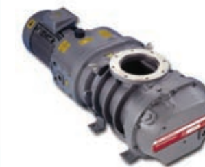
BOC Roots Pumps

Для создания вакуума используется вакуумный насос BOC Edwards.