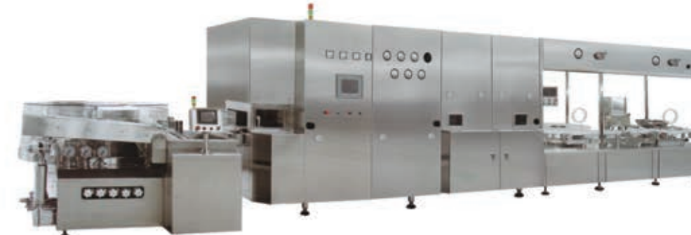
Ампульная и флаконная линия