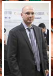
A. Rizzardi, «Convel»