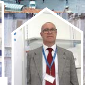
D. Postacchini, «Amphenol»

15 апреля 2016 г. в Болонье завершилась пятая международная выставка Pharmintech, организуемая компанией Bologna Fiere и посвященная техническим решениям для фармацевтической отрасли. На выставке Pharmintech 2016 был представлен весь комплекс последних технологических новшеств в фармацевтической, парафармацевтической, нутрицевтической и косметической промышленности. Специалисты отрасли получили возможность узнать о новейших достижениях в области оборудования, средств автоматизации, материалов, упаковки, подрядного производства, «чистых помещений», оснащенных инструментальными средствами.