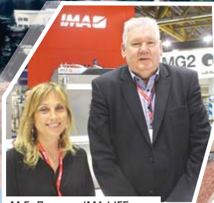
М.Г. Лолли, «IMA LIFE», А. Рельф, «IMA East»