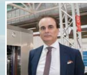
M. Castellarin, «Last Technology»