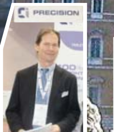
A. Spense, «Precision»