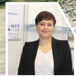
J. Hampe, «Roehling-HPT»