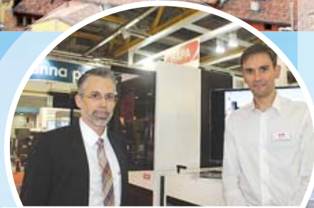
C. Ulrich, «Coesia», S. Simon, «HAPA»